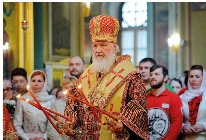
Святейший Патриарх Московский и всея Руси Кирилл.

Нравственный закон может быть обязательным для всех только в том случае, если он основывается на Божественном законе. Вот для того