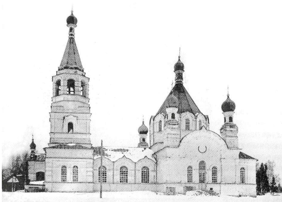
Храм в честь Владимирской иконы Божией Матери с. Пиксур (Владимирское).