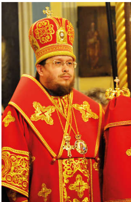
Епископ Яранский и Лузский Паисий

— Владыка, сегодня очень часто в церковной среде приходится сталкиваться с необычным словом катехизация. Перед крещением родители и крестные должны прослушать катехизические беседы, педагогам, преподающим в школе предмет ОПК (Основы православной культуры) необходимо пройти катехизаторские курсы и т.д. Посвятим нашу беседу этой теме и начнем с вопроса, что такое катехизация?