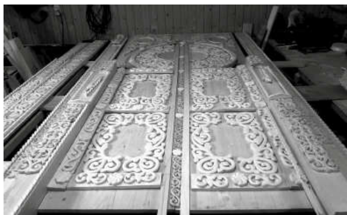
Деревянное кружево станет украшением нового храма.

— Пусть рука где-то и сбилась, это не беда. Зато придет внук в храм, увидит и скажет, что дед все это вручную сделал. А на станке получится штамповка, — возражает мастер.